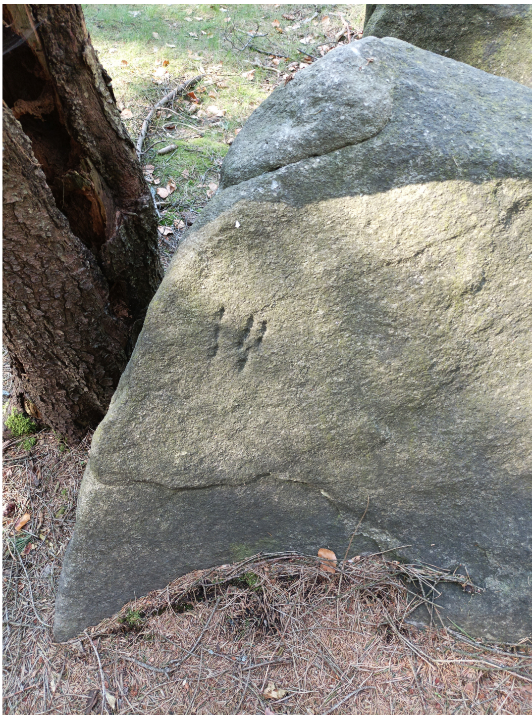
Obrázek č. 1/3

Značka tři čáry na jižní straně obětního kamene. Nejspíše jde o sluneční znamení.