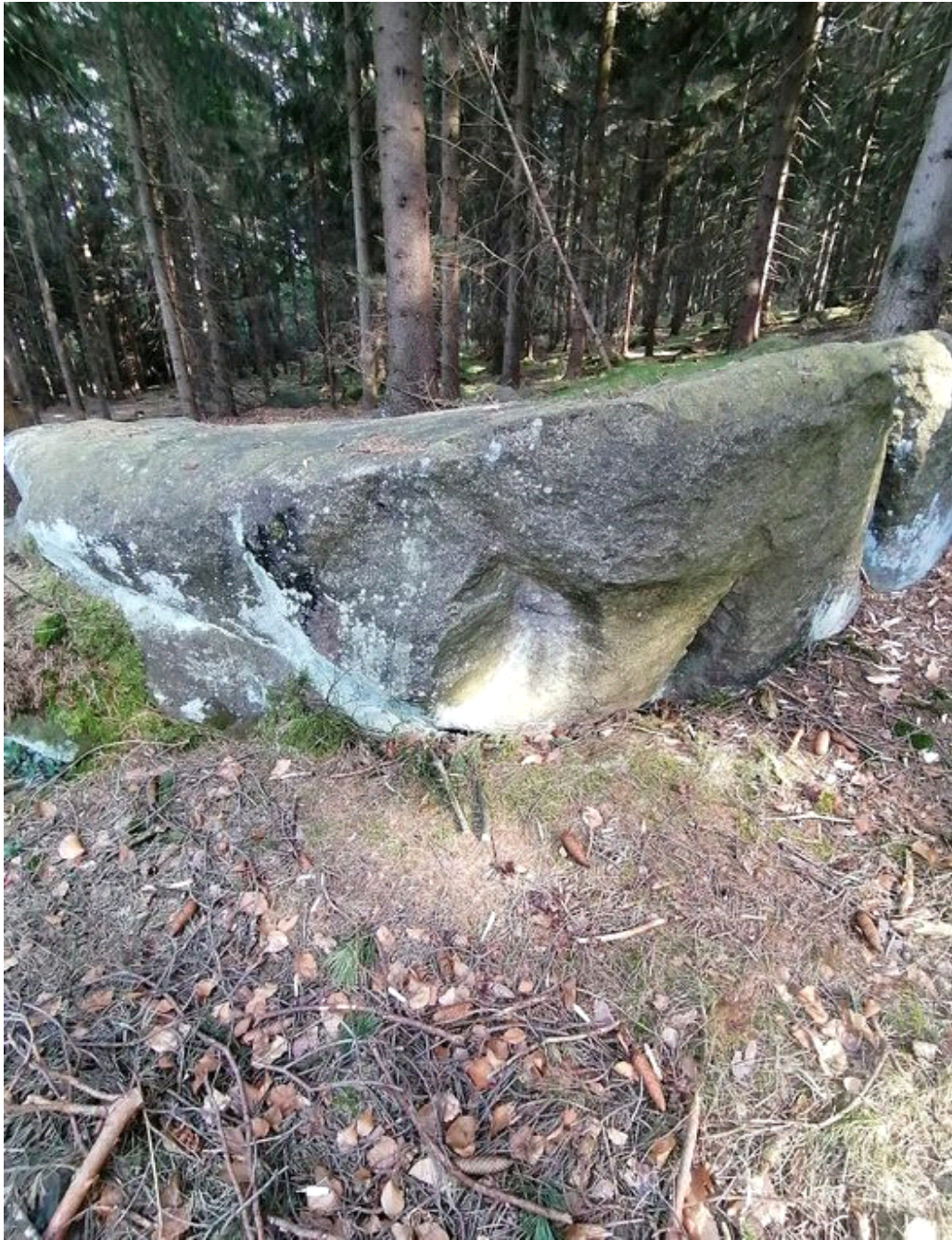
Obrázek č. 1/2