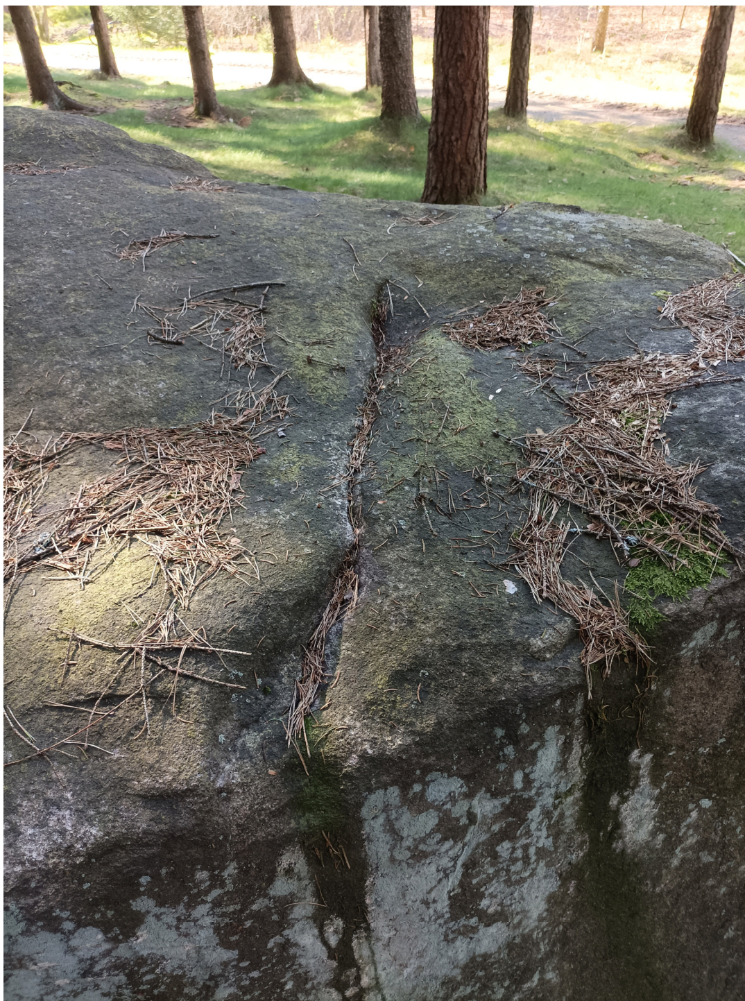
Obrázek č. 1/4