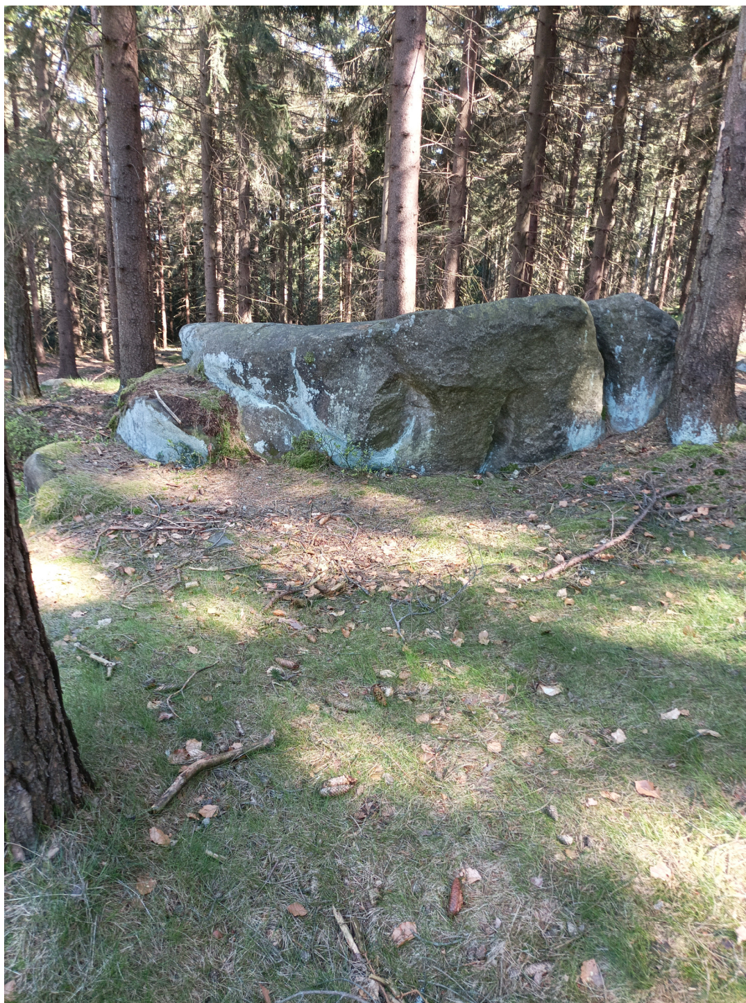
Obrázek č. 1/1

Severní strana obětního kamene s vyobrazením ležící hlavy s pokrývkou hlavy na způsob frygické čapky či noční čepice.